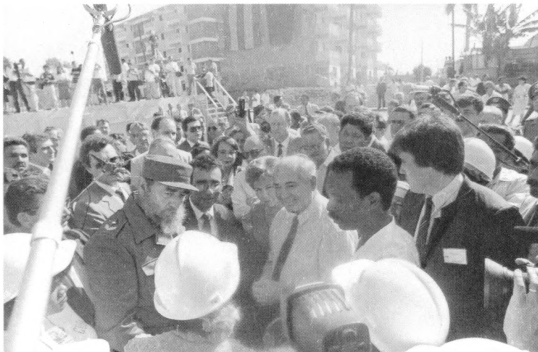
Встреча со строителями