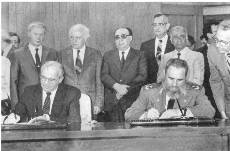
Подписание Договора о дружбе и сотрудничестве между СССР и Республикой Куба