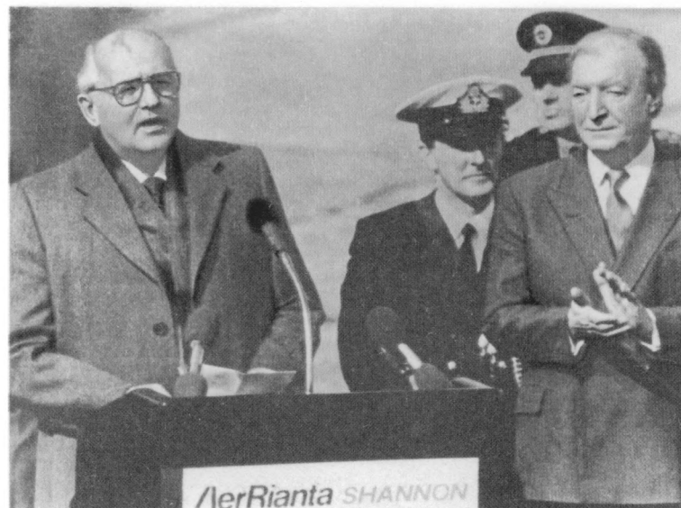
М. С. Горбачев выступает в аэропорту Шэннон (Ирландия)

Особенно перспективна кооперация в машиностроительном производстве, прежде всего в выпуске современных приборов, радио- и телеаппаратуры, бытовой техники. Это помогло бы Кубе активнее участвовать в системе разделения труда в рамках СЭВ, да и в мировых хозяйственных связях, в том числе в Латинской Америке.